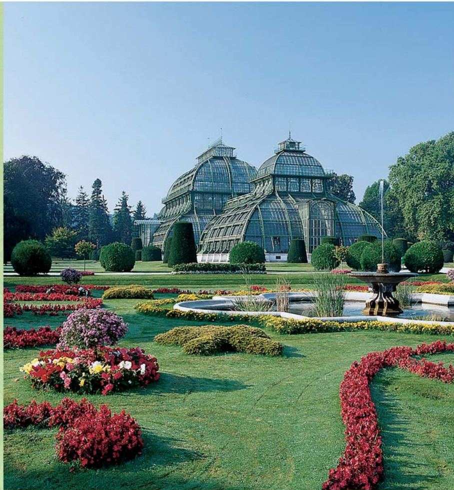
A pálmaház Palmárium

V desertáriu, nacházejícím se v bývalém Domě se slunečními hodinami z let 1904-05, spatříte faunu a flóru z pouští z celého světa.