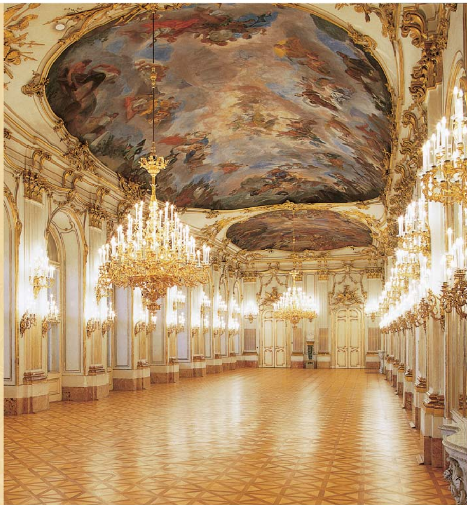
Nagy képtár Velká galerie